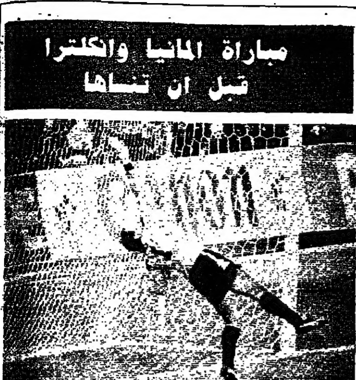
كرة الأندلس بريمه دخل مرمى سيلتون (روبي)